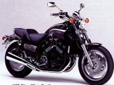
NSD (New Silver Dust)