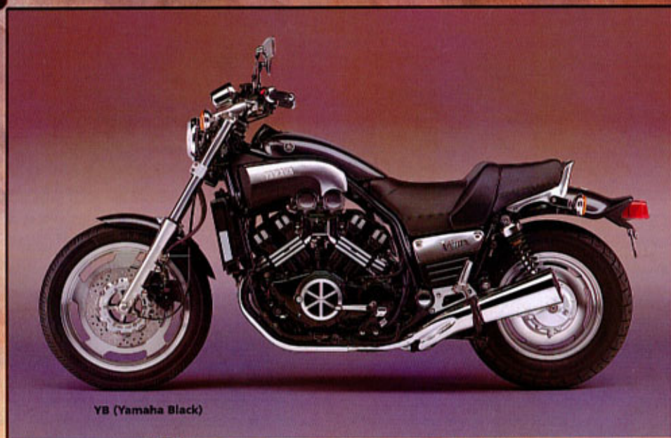
YB (Yamaha Black)